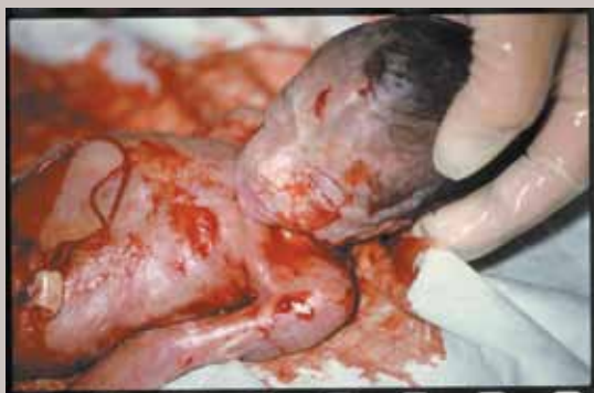
Fotografie z DVD Svoboda volby . Několikaminutový dokument je vhodný především k diskusi se zatvzrelými obhájci současného zákona o umělých potratech.